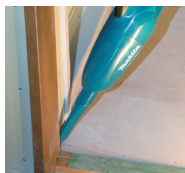
Imagem : DCL180