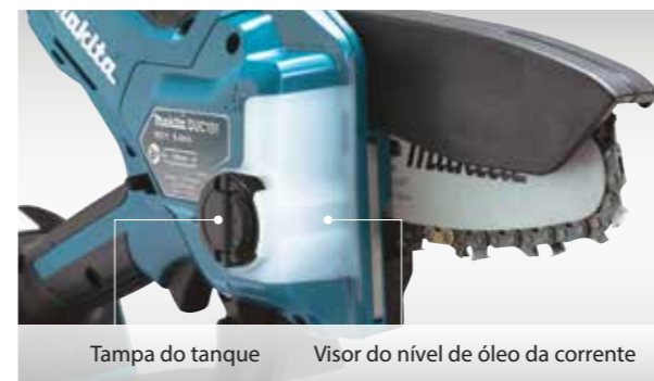
Tampa do tanque Visor do nível de óleo da corrente

Minimiza as chances de travar a corrente.