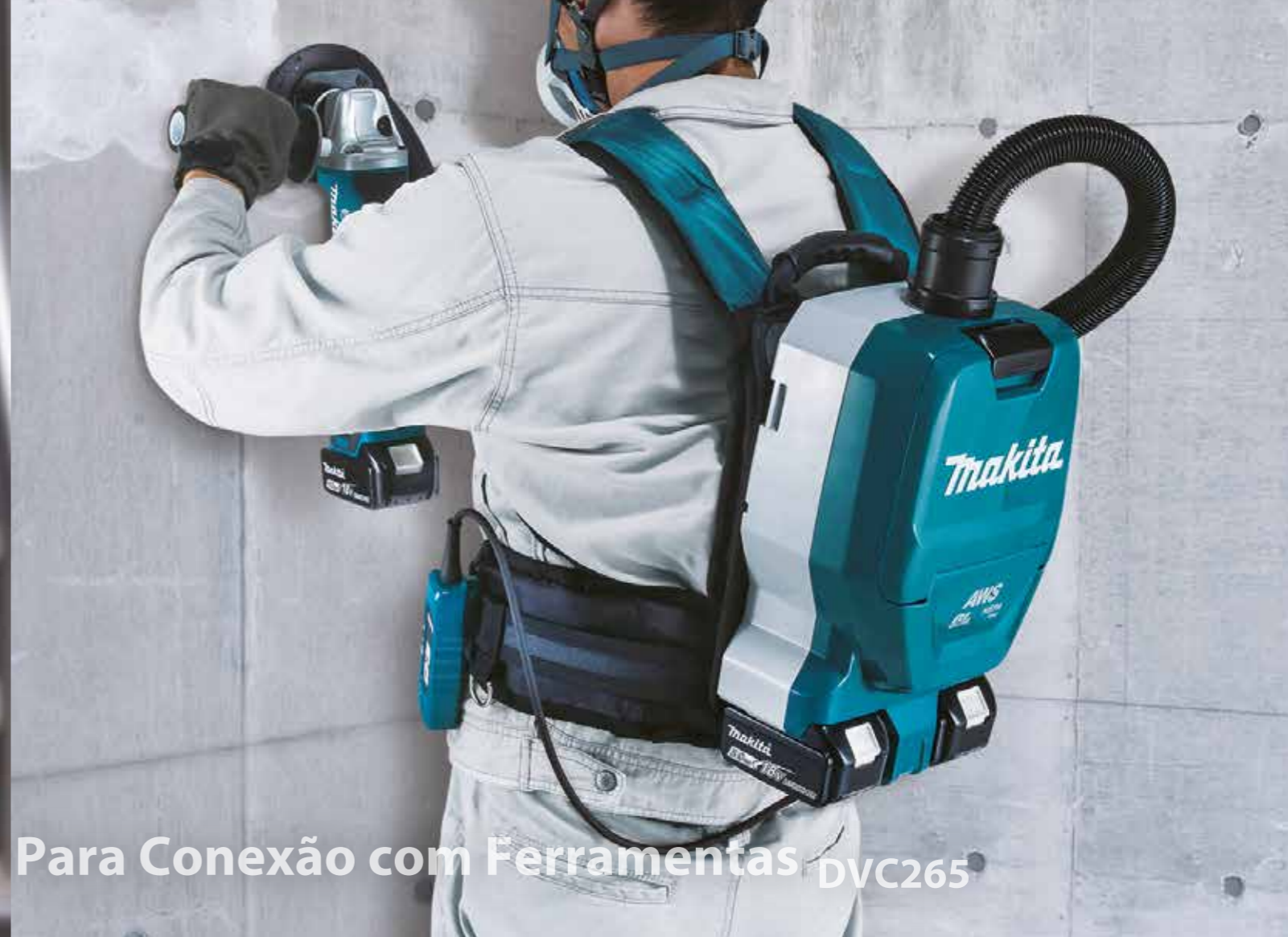
Para Conexão com Ferramentas DVC265