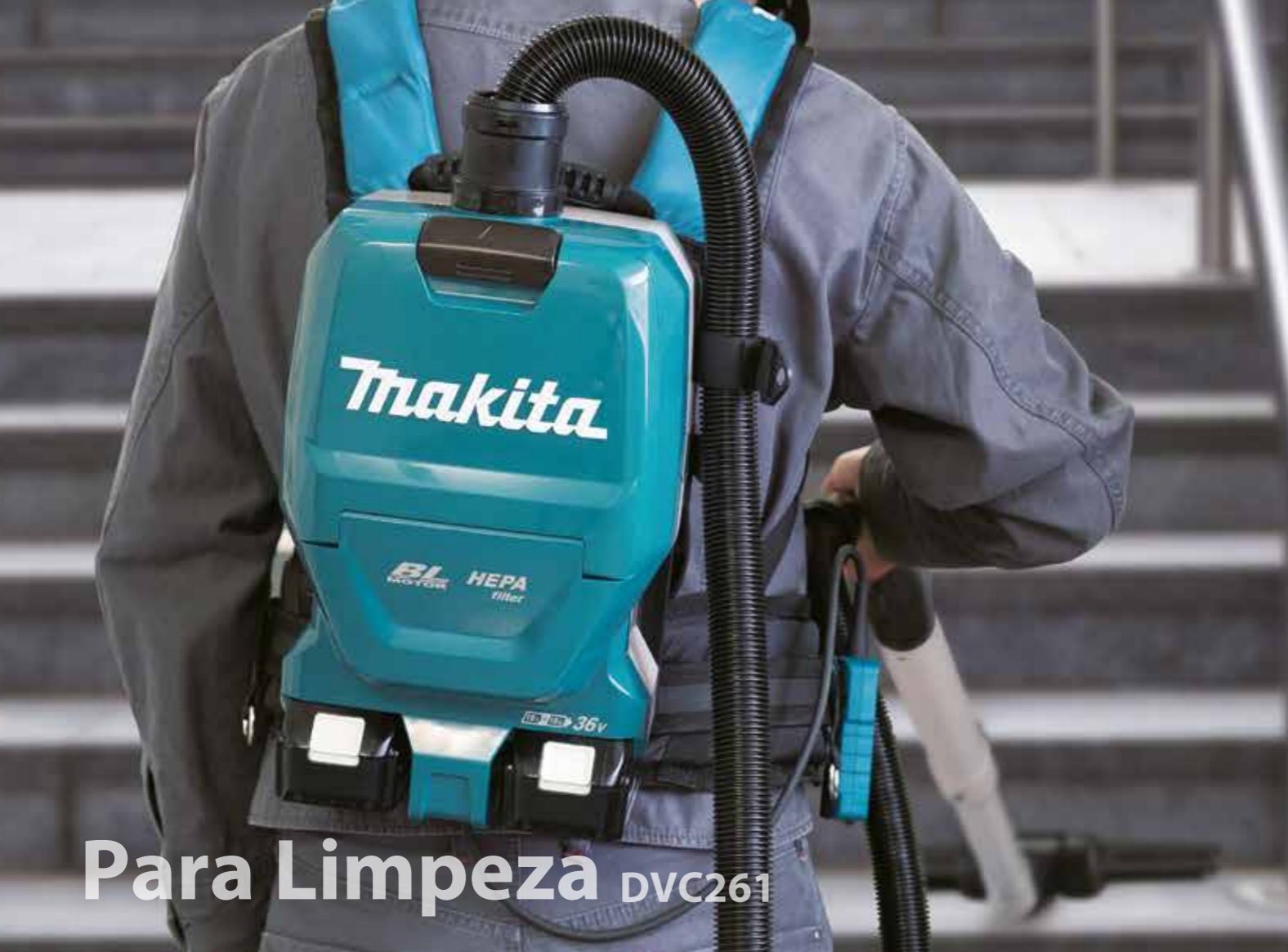
Para Limpeza DVC261