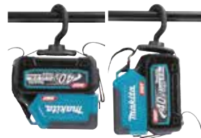
Alça com gancho (acessório opcional)

A alça com gancho é presa aos dois orifícios na lanterna, de modo que pode ser usada em posição invertida.