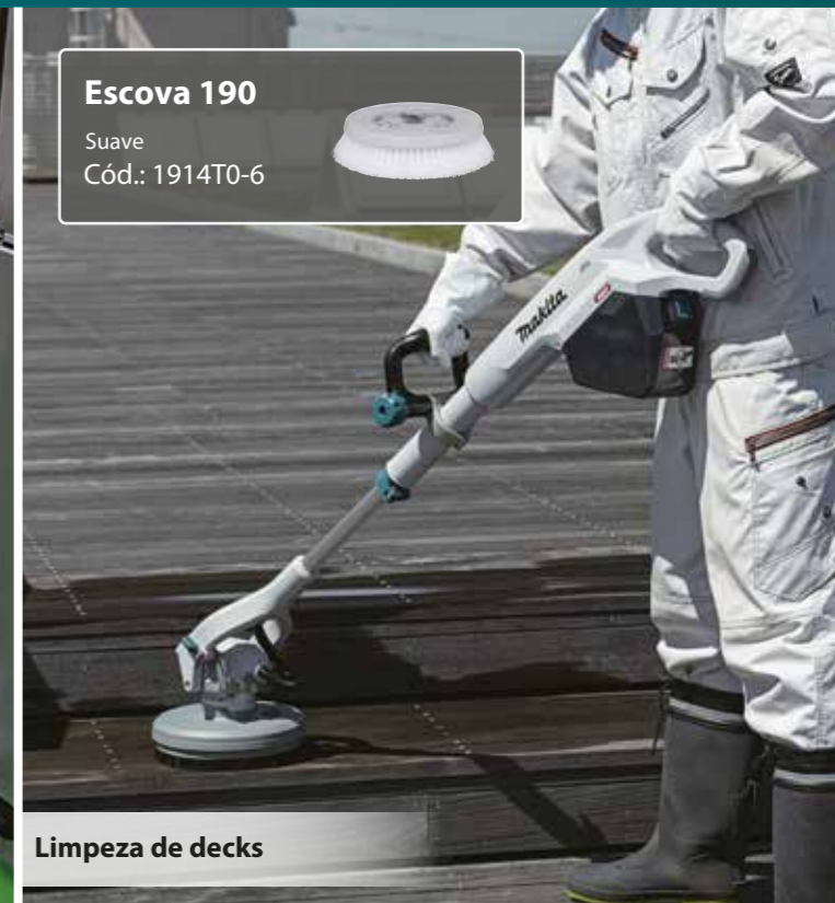
Limpeza de decks