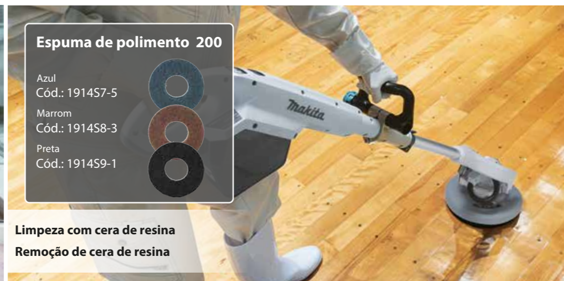
Limpeza com cera de resina Remoção de cera de resina