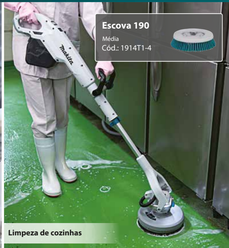
Limpeza de cozinhas