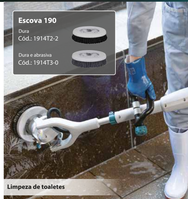
Limpeza de toaletes