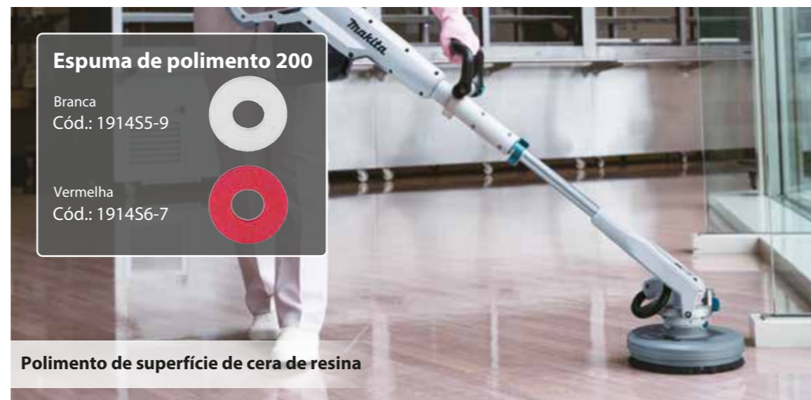
Polimento de superfície de cera de resina