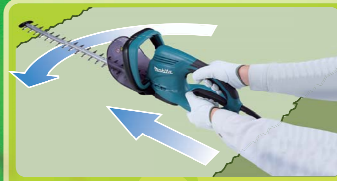
Apoio principal e apoios secundários para um alcance extra longo

Duas chaves de segurança disponível em todas as aplicações