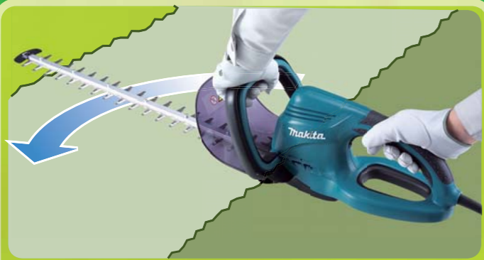
Apoio frontal e apoios principais para fácil aparagem da parte superior da cerca viva