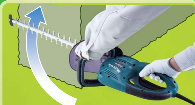
Apoio frontal e apoios secundários para uma aparagem eficiente da parte lateral da cerca viva