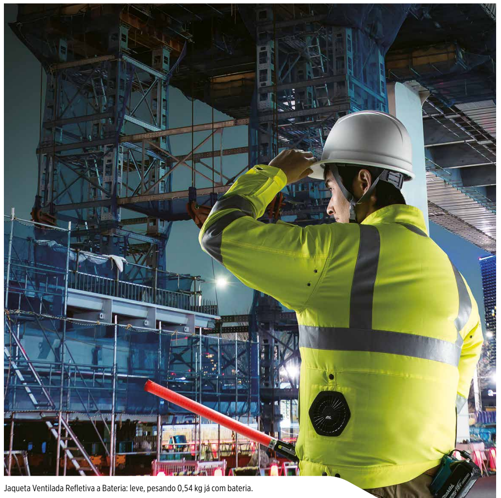
Jaqueta Ventilada Refletiva a Bateria: leve, pesando 0,54 kg já com bateria.

DFJ214Z: Não acompanha adaptador, bateria e carregador.